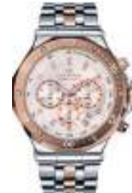
STATUS CHRONO SERIES 5025M