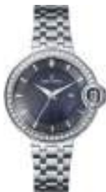
AURORA SERIES 5028L