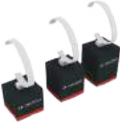
WATCH STAND (GENTS) Set of 3 pieces TF-D005