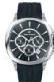
SARATOGA SERIES 5029M