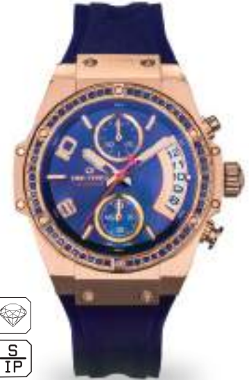
TF5039LRS-N04 ø 36MM