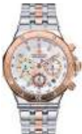
STATUS LADY SERIES 5025L