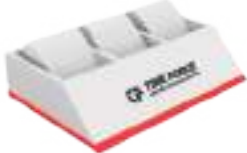
DISPLAY FOR 3 WATCHES (LADY) TF-D011W