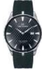
TIME MASTER ULTRA SLIM SERIES 5041M