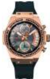
VORTEX LADY SERIES 5039L