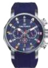
SAILING SERIES 5020M