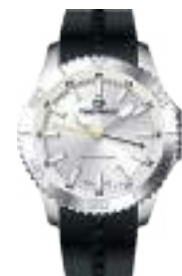
ROOKIE SERIES 5034M