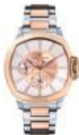
SARATOGA LADY SERIES 5029L