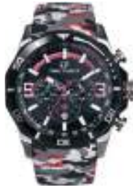
SPECTRUM GHOST LTD SERIES 5036M