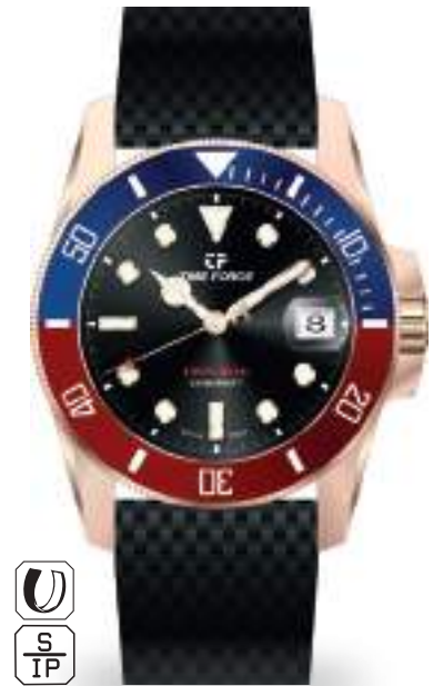
TF5042M-02 ø 44MM