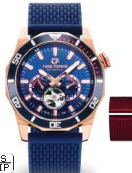
TF5035MR-01LTD ø 44MM