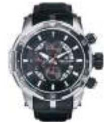
TIME MASTER SERIES 5022M