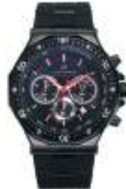
STATUS CHRONO SERIES 5025M