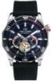
SPECTRUM LTD MACCHINA SERIES 5035M