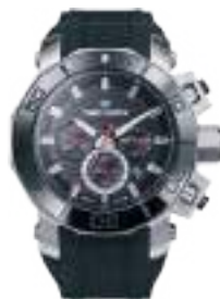
MEGALODON SERIES 5019M