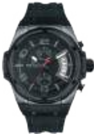
VORTEX SERIES 5024M