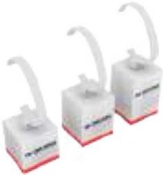
WATCH STAND (LADY) Set of 3 pieces TF-D005W