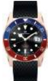
IMPERIAL SPORT SERIES 5042M