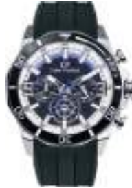
SPECTRUM SERIES 5027M