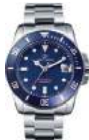
IMPERIAL SERIES 5023M