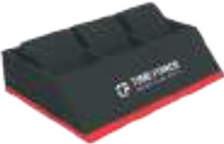
DISPLAY FOR 3 WATCHES (GENTS) TF-D011