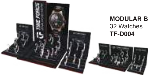
MODULAR BIG DISPLAY 32 Watches TF-D004