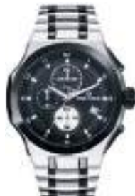
SIRIUS SERIES 5021M