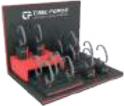
MEDIUM DISPLAY 20 Watches TF-D012