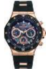
STATUS LADY SERIES 5025L